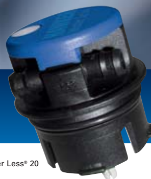
Bouchon Water Less® 20